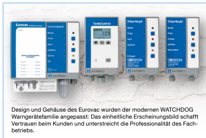
Design und Gehäuse des Eurovac wurden der modernen WATCHDOG Warngerätefamilie angepasst: Das einheitliche Erscheinungsbild schafft Vertrauen beim Kunden und unterstreicht die Professionalität des Fachbetriebs.

Eurovac entspricht EMV-Richtlinie (2004/108/EG), der Niederspannungs-Richtlinie (2006/95/EG) und der CE-Kennzeichnung nach EU-BauPVO 305/2011, EN 13160-1, -2.